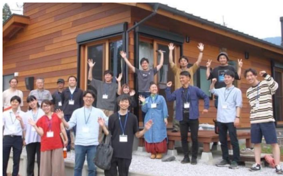
Vol.1_エコハウス・暮らし