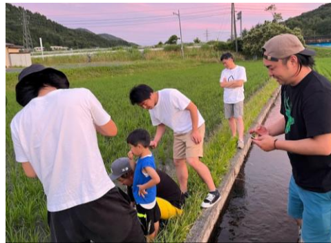
Vol.2_教育・水・エネルギー