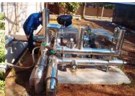
市有施設に導入した温泉熱利用設備