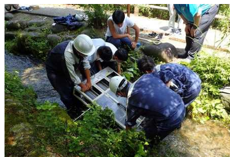
地元高校生が設置した小水力発電