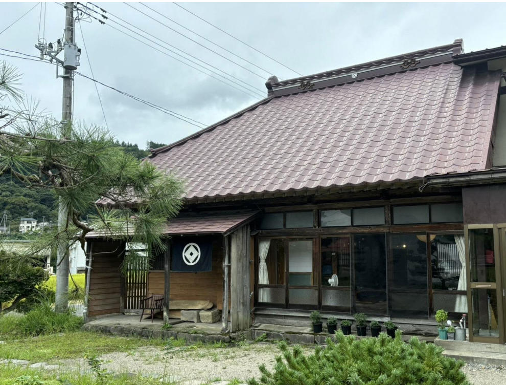
Creative Village 叶屋