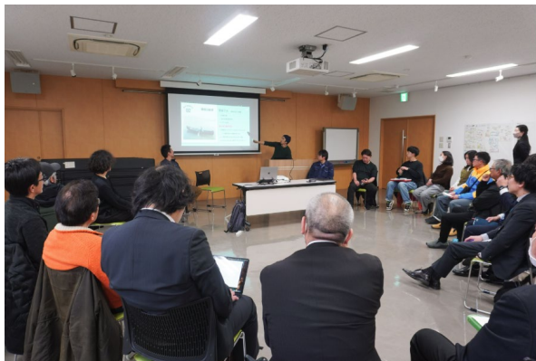
多様なステークホルダー

また、各浜の後ろをぐるりと囲む山は、戦後に植えられたスギ林が輸入材の影響で価値がなくなり、手入れがされず荒れているだけでなく、風倒木や土砂の流入により沢が埋まり保水力が低下している。これらの影響により、昔は多く見られたウナギやアユ、サケ、シロウオなどが激減し、湾内の海水温上昇や山からのミネラルの遮断など多くの弊害をもたらしている。 近年はニホンジカの急増により、新芽や下草が食べられ、森林環境がさらに悪化する原因となっている 。