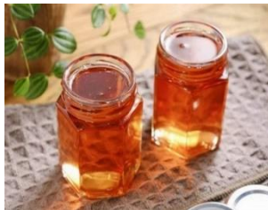
(試作中) リンゴの皮を 活用したジャム