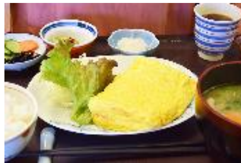
特産品を活用した名物グルメ