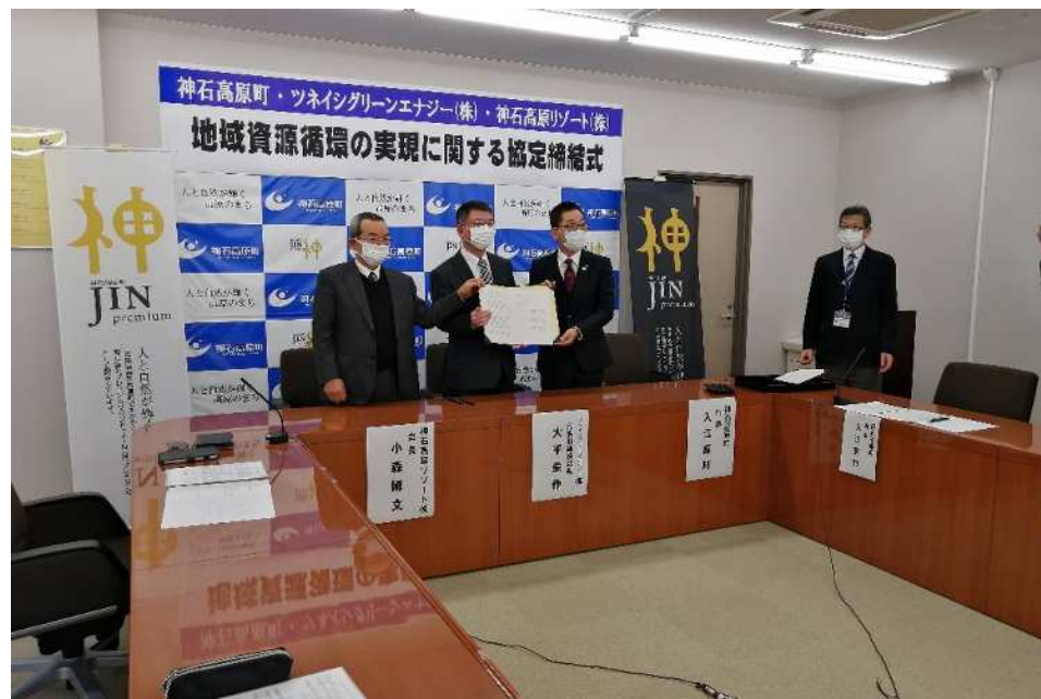
連携協定締結式の様子