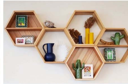
インテリア・家具・什器

ウッドプラスチックのエクステリア製品や木の塗り壁など国産材を活用した資材・工事を扱っています。 各種認証や基準に準拠した安心安全の土木・建築資材については是非ご相談ください。