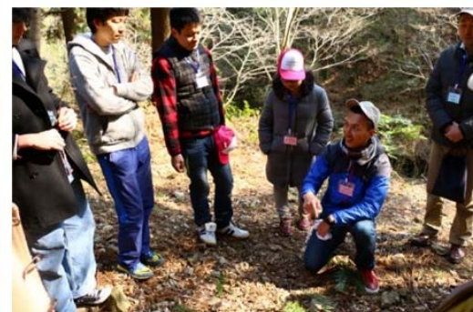
コンサルティング

無垢材や木粉を活用し、環境に優しくカッコいいモノづくりをおこなっています。 食器やスマホスタンドからうわち・フラワーポット・お香まで店舗での活用やノベルティとしても喜ばれています。