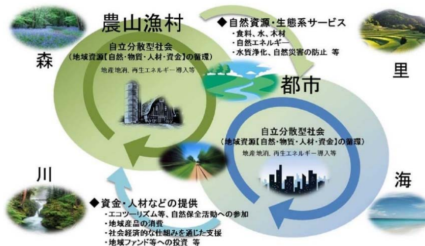
図 那賀ウッドが目指す地域循環共生圏の概念図