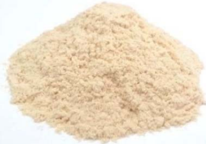
木粉・木粉活用製品

地域材を新技術により丁寧に粉砕加工した 多用途に活用できる自然素材の「木粉」と 木粉を活用した環境に優しい製品