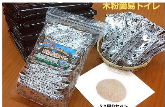
防災・コロナ対策

木のある過ごしやすく快適な空間づくりや施設の魅力を高めお客様の満足度の向上のためにご要望をお聞きしながらオーダーメイドで対応します。 リゾートホテル・結婚式場・カフェなどでも喜ばれています。