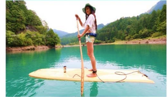
ウッドボード・ウッドプレート

“山と川と海と人をつなぐ”木頭杉の製品 サーフィンやSUP、キャンプなどのレジャーや インテリア、食卓で活躍します