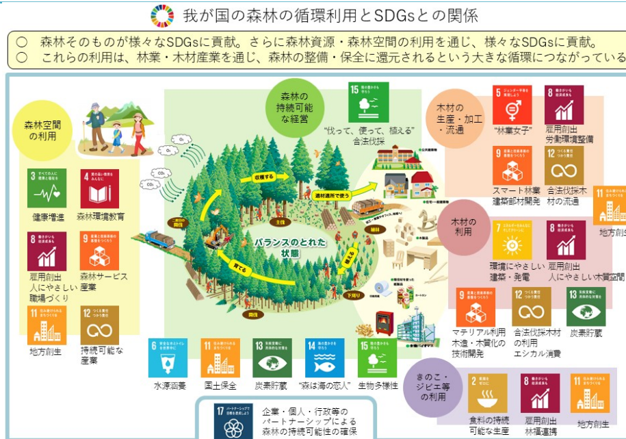
図 那賀ウッドが目指す森林の循環利用×SDGsの概念図