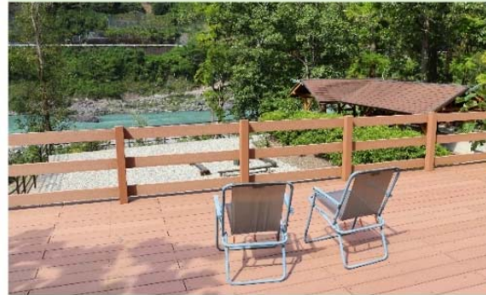
木材・プラスチック再生複合材 (WPC)

徳島県産の木粉と樹脂を混練したエクステリア資材 経年変化が非常に少なく、 性質そのままでも美しさも長持ちします