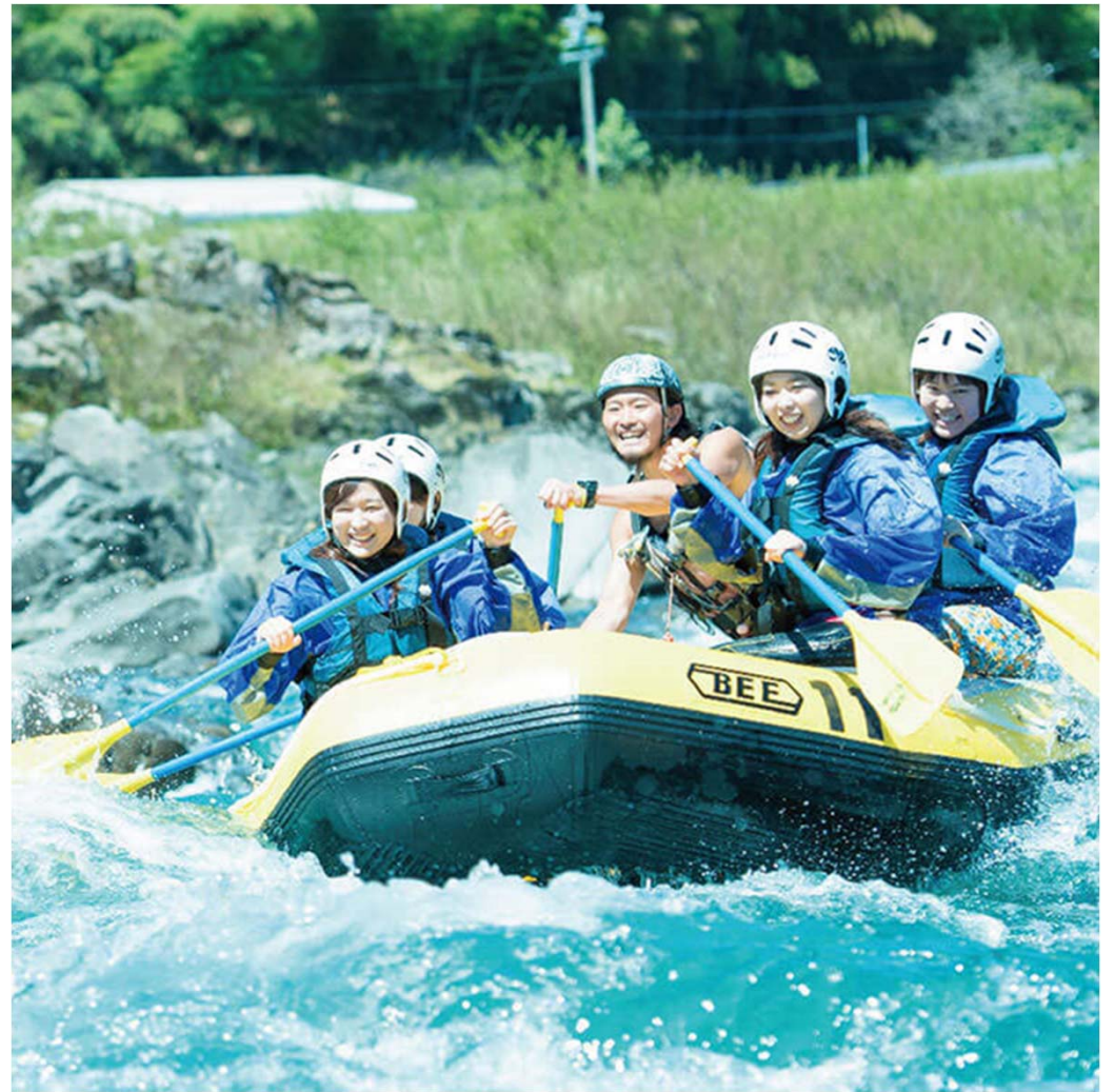
長良川のラフティング