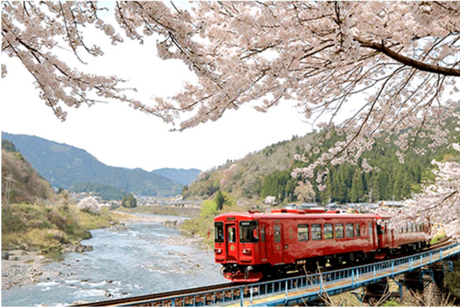
(観光列車ながら)