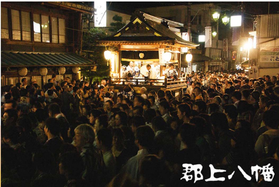
郡上市アウトドア事業者協議会のHPより 郡上のイメージ動画 https://youtu.be/LlpYLvHPig8