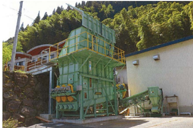
一勝地温泉かわせみで稼働している 「バイオマスボイラー」