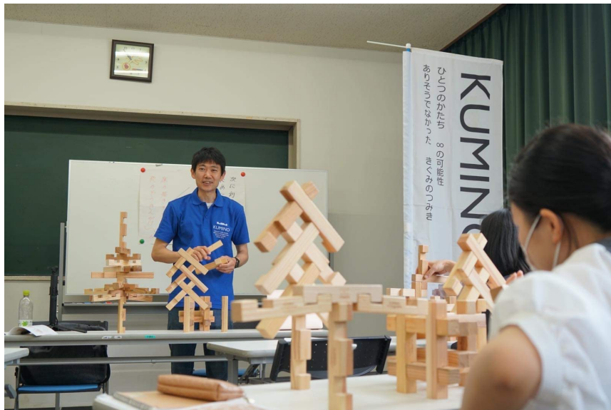
地域産材を使ったクミノは、様々な地域と出会い繋がっている

「森と人をつなぐかたち」をコンセプトに全国の地域産材を用いたオリジナルの木製玩具「クミノ」の製造・販売に取り組んでいる。