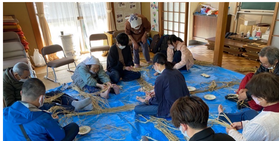
山の暮らしの文化体験