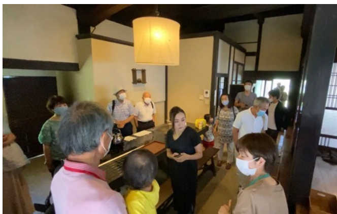
立ち上げのきっかけになった視察